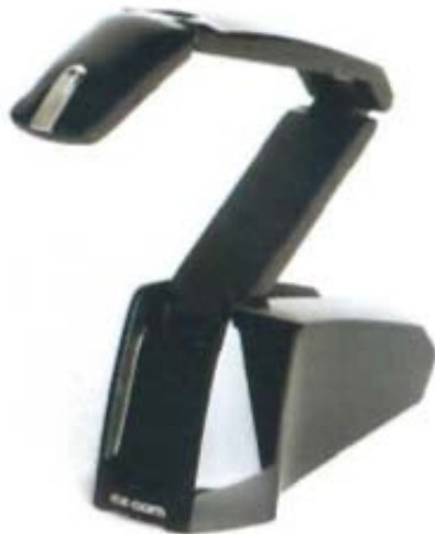
Image Recognizing Digital Visualizer EZ-CAM EZ-500 & EZ-500TTS